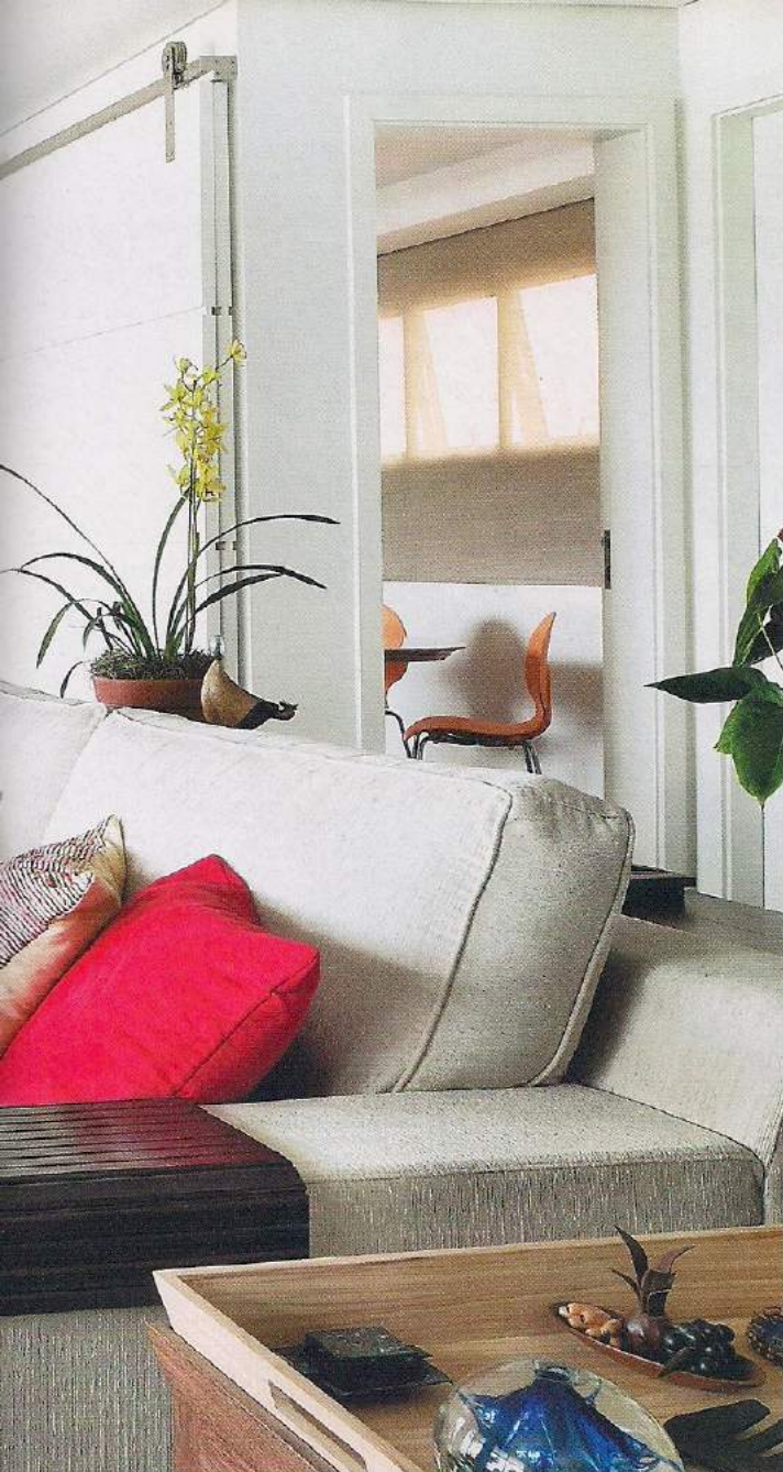
A sala de almoço, composta pela mesa Saarinen e cadeiras coloridas (Isto É Brasil) e pelo bufê (Italy Móveis), fica separada pela porta de correr da sala de jantar