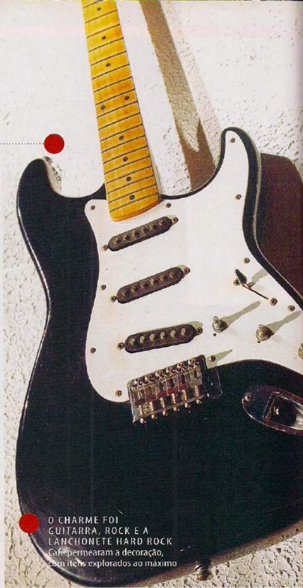
O CHARME FOI GUITARRA, ROCK E A LANCHONETE HARD ROCK. Café permearam a decoração, com itens explorados ao máximo

Café; chás; involtine de chocolate com nozes; minipalmiere; minitruflas de chocolate branco ao leve toque de limão siciliano e de chocolate ao leite; minicopinhos com recheio de Nutella, cocadinha, bicho de pé e brigadeiro.