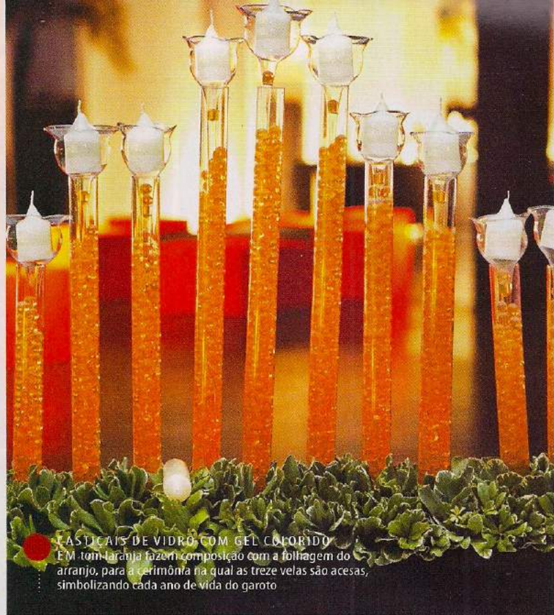
• CASTIÇAIS DE VIDRO, COM GEL COLORIDO EM tom laranja fazem composição com a folhagem do arranjo, para a cerimônia na qual as treze velas são acesas, simbolizando cada ano de vida do garoto