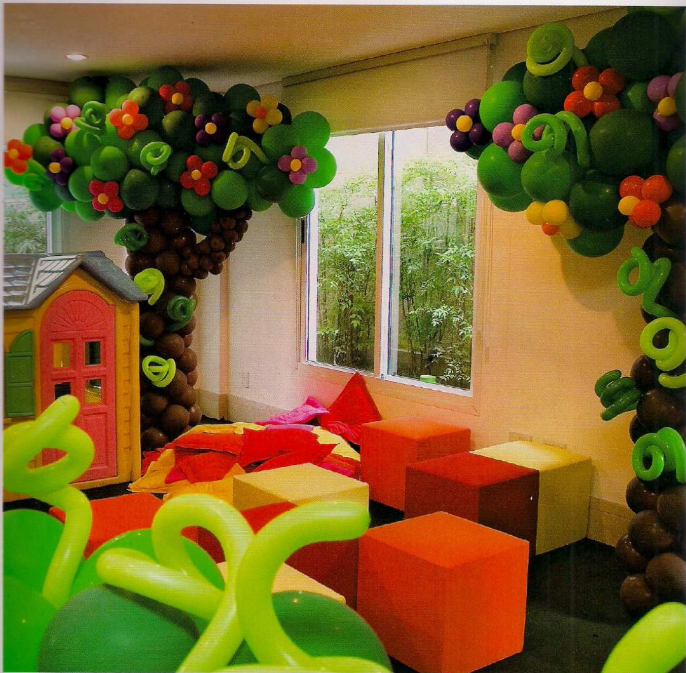
Acima, na área infantil, brinquedos e árvores montadas com escultura de bexigas.

O salão de festas do prédio da família foi dividido em duas áreas distintas: crianças e adultos. A área de recreação das crianças recebeu carpete verde e decoração com esculturas de balões em forma de árvores e sapos, que simularam o “brejo da Bebel”. Brinquedos adequados à idade, pufes e almofadas coloridas em tons de laranja, vermelho e amarelo deram ainda mais vida ao espaço. Um cercadinho de balões em tons de verde serviu para separar a área dos adultos.